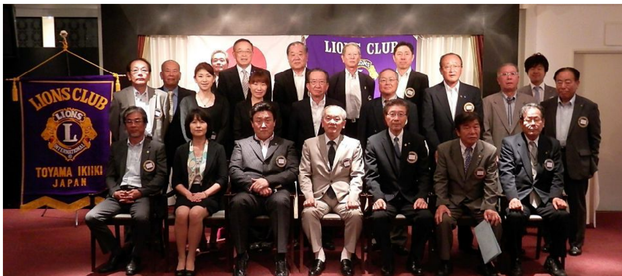
第214回例会 ～年次例会～ 2013. 6. 2