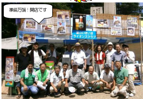
準備万端! 開店です